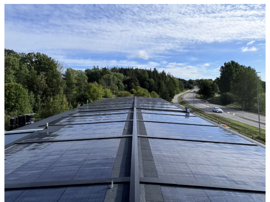
Version 8.3 2025-01-28

Våra högeffektiva CIGS-celler är fria från giftigt kadmium , tack vare vår unika och innovativa maskin, Midsummer DUO.